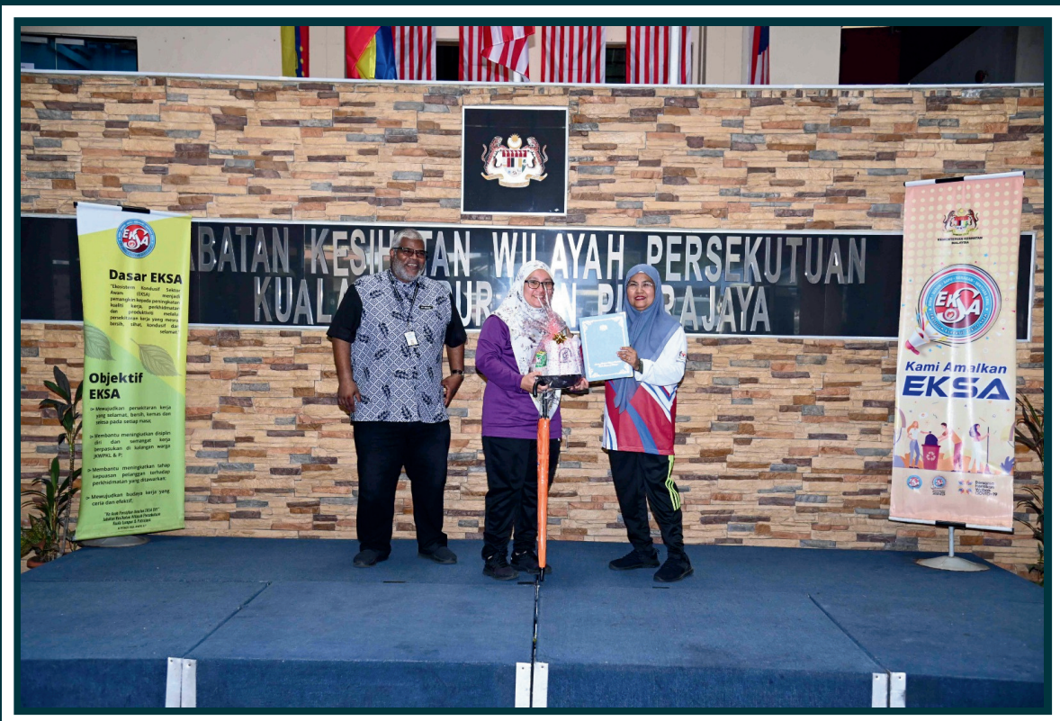
Anugerah Amalan Terbaik EKSA 2023: Hasil Inovasi Kreatif Terbaik - Zon Pergajian