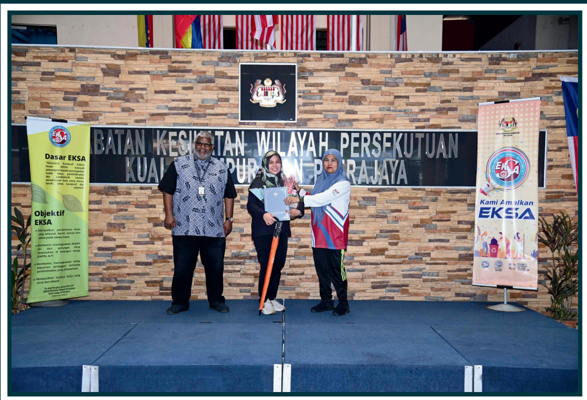
Anugerah Amalan Terbaik EKSA 2023: Workstation Terbaik - Zon Perubatan