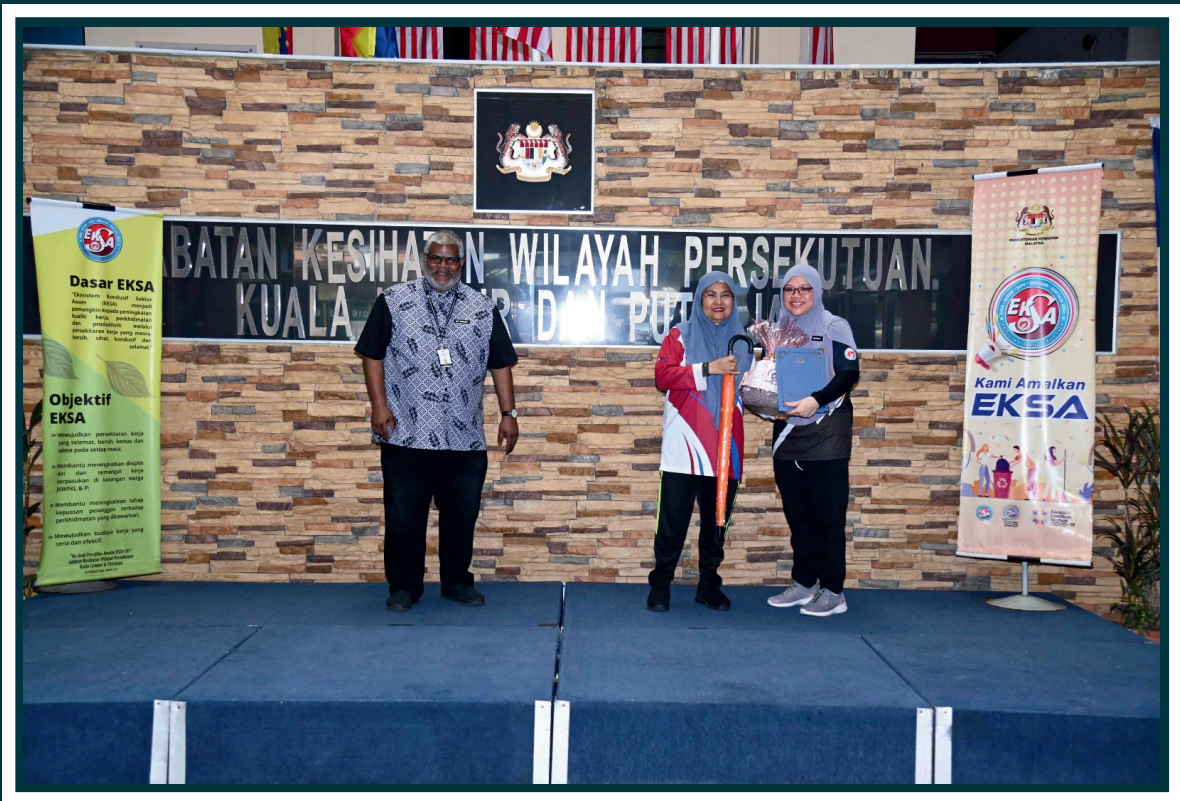
Anugerah Amalan Terbaik EKSA 2023: Tandas Terbaik - Kesihatan Awam