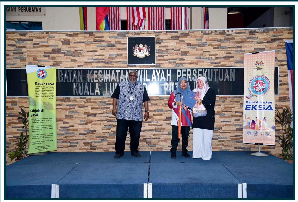
Anugerah Amalan Terbaik EKSA 2023: Go Green Terbaik - Zon Pengurusan