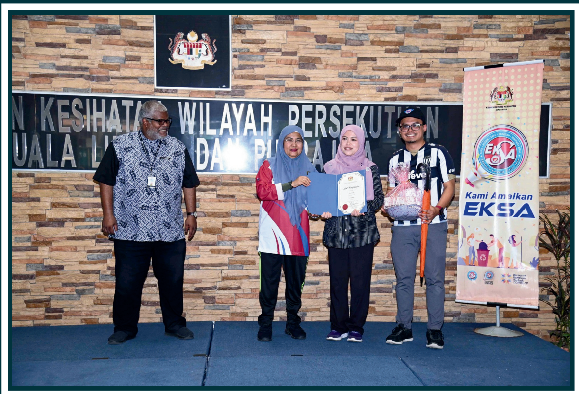
Anugerah Amalan Terbaik EKSA 2023: Zon Terbaik - Zon Farmasi