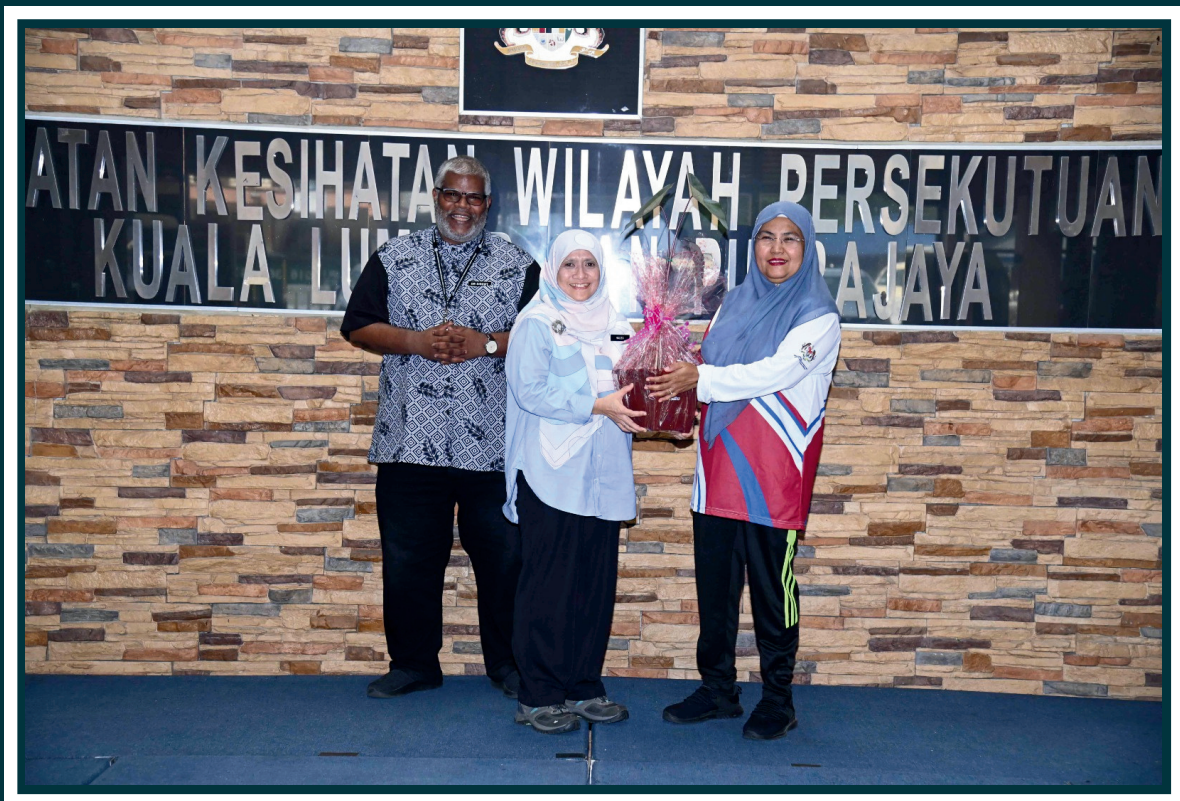
Anugerah Amalan Terbaik EKSA 2023: Bilik Terbaik - Pengarah Kesihatan Negeri