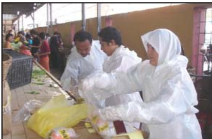
Gambar 2: Beberapa aktiviti pensampelan yang telah dilakukan sepanjang tahun 2008 di beberapa premis di sekitar Kuala Lumpur

Januari 2008: Pegawai Berkuasa dibantu oleh PKA sedang melaksanakan tugas-tugas pensampelan daging babi di sebuah pasar basah di Kuala Lumpur.