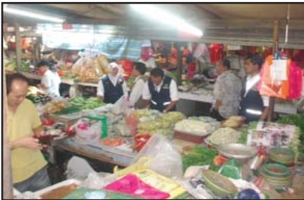
Gambar 3: Aktiviti pensampelan yang telah dilakukan sepanjang tahun 2008 semasa operasi pengawasan penyalahgunaan beberapa bahan terlarang di dalam makanan

Februari 2008: Pegawai Berkuasa sedang memeriksa dan mengambil sampel mi kuning semasa operasi pengawasan penyalahgunaan asid borik dalam mi.