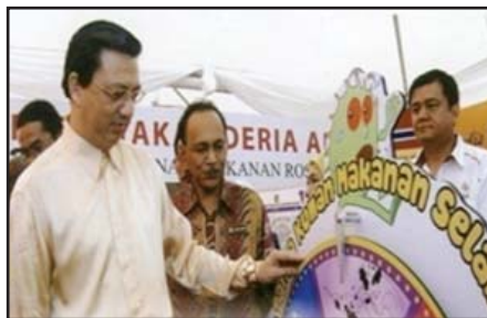
Gambar 5: Beberapa program Promosi dan Pendidikan Keselamatan Makanan

Jun 2008: YB Menteri Kesihatan ketika melawat tapak pameran Keselamatan dan Kualiti Makanan.