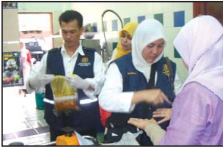
Gambar 1: Beberapa siri pemeriksaan dan aktiviti penguatkuasaan terhadap premis pengendali makanan yang telah dilakukan sepanjang tahun 2008

Mac 2008: Pegawai Berkuasa sedang mengambil sampel makanan dan membuat ujian 'swab' terhadap pengendali makanan semasa pemeriksaan premis di sebuah restoran dilakukan.