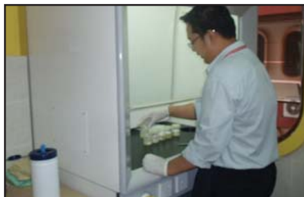
Gambar 3: Beberapa ujian menggunakan test-kit

Penolong Pegawai Teknologi Makanan sedang menjalankan ujian menggunakan test-kit di Bilik Sampel UKKM.