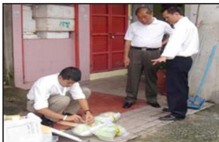
Gambar 4: Beberapa aktiviti pengawalan makanan import

Mac 2008: Pegawai Berkuasa sedang mengambil sampel di sebuah gudang penyimpanan konsaimen makanan yang diimport untuk dianalisis.